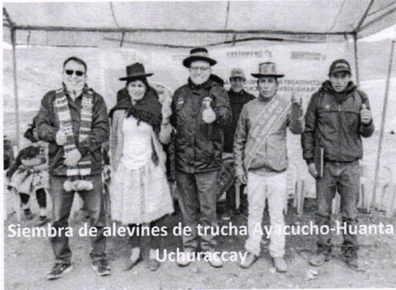
Siembra de alevines de trucha Ayacucho-Huanta Uchuraccay