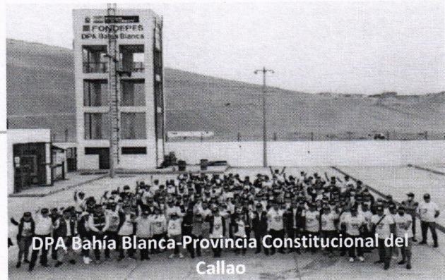
DPA Bahía Blanca-Provincia Constitucional del Callao