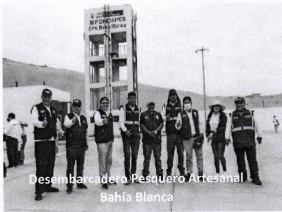
Desembarcadero Pesquero Artesanal Bahía Blanca