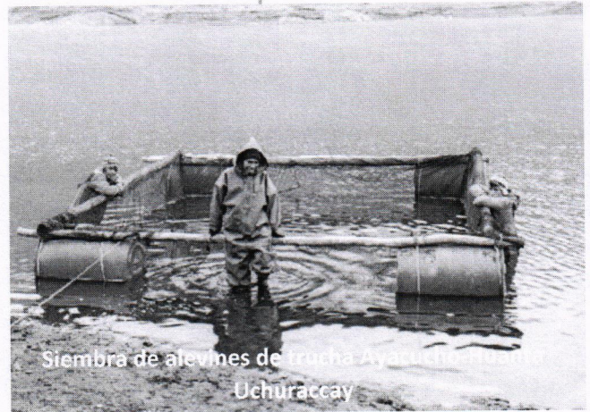
Siembra de alevines de trucha Ayacucho-Huanta Uchuraccay